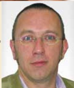
Mag. TERZAKI Terzaki Unternehmensberatung